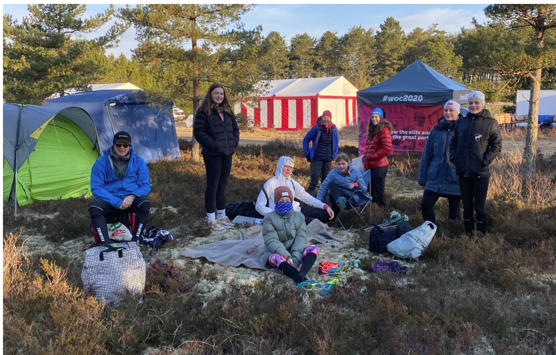
Her ser vi et flott utvalg av fjorårets Grane-deltakere på Nordjysk, i år fra Skagen.

19. mai deltok klubben på Åpen Hall prosjektet med en orienteringstrening i Arendal Idrettspark, Myra. Treningen var todelt med introduksjon og Belgisk orientering innendørs før vi gikk gjennom en nybegynnerløype ute. Et veldig hyggelig arrangement med 8 deltakere.