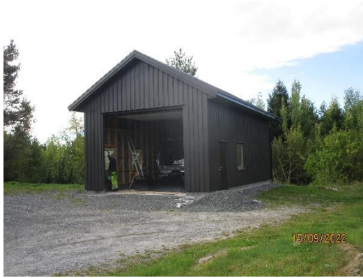
Garasjegavl med port