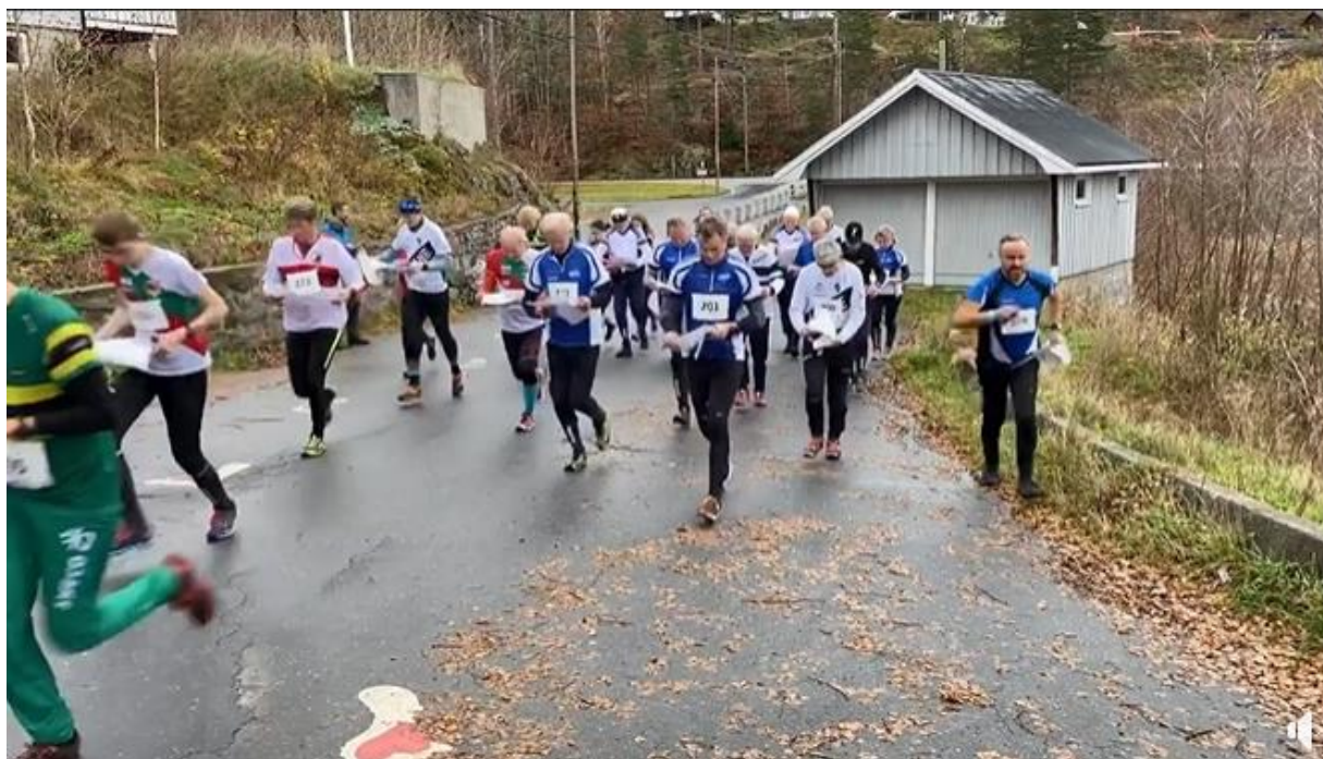
Start lang løype - Graneløpet 2022