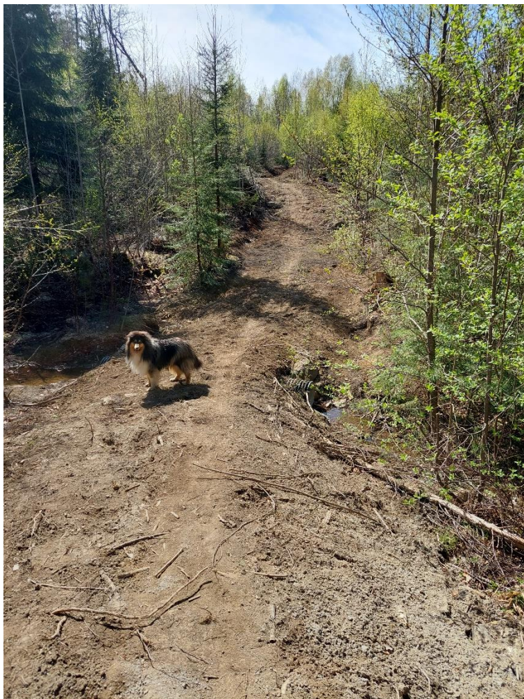
Ugleboløypa - stikkrenne laveste punkt mot nord.

Vi har videreført oppgradering av Ugleboløypa ved å utbedre et stykke på 300 m mot nordre den av Krakstadvannet. Med gode kantgrøfter og godt dimensjonerte stikkrenner skiller vi vannvei og tursti.