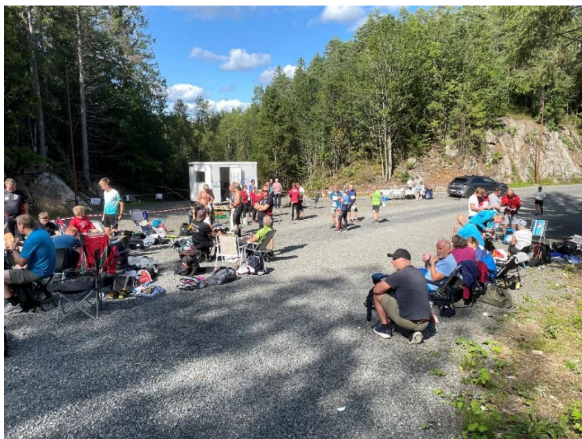
Bilder fra KM stafett.