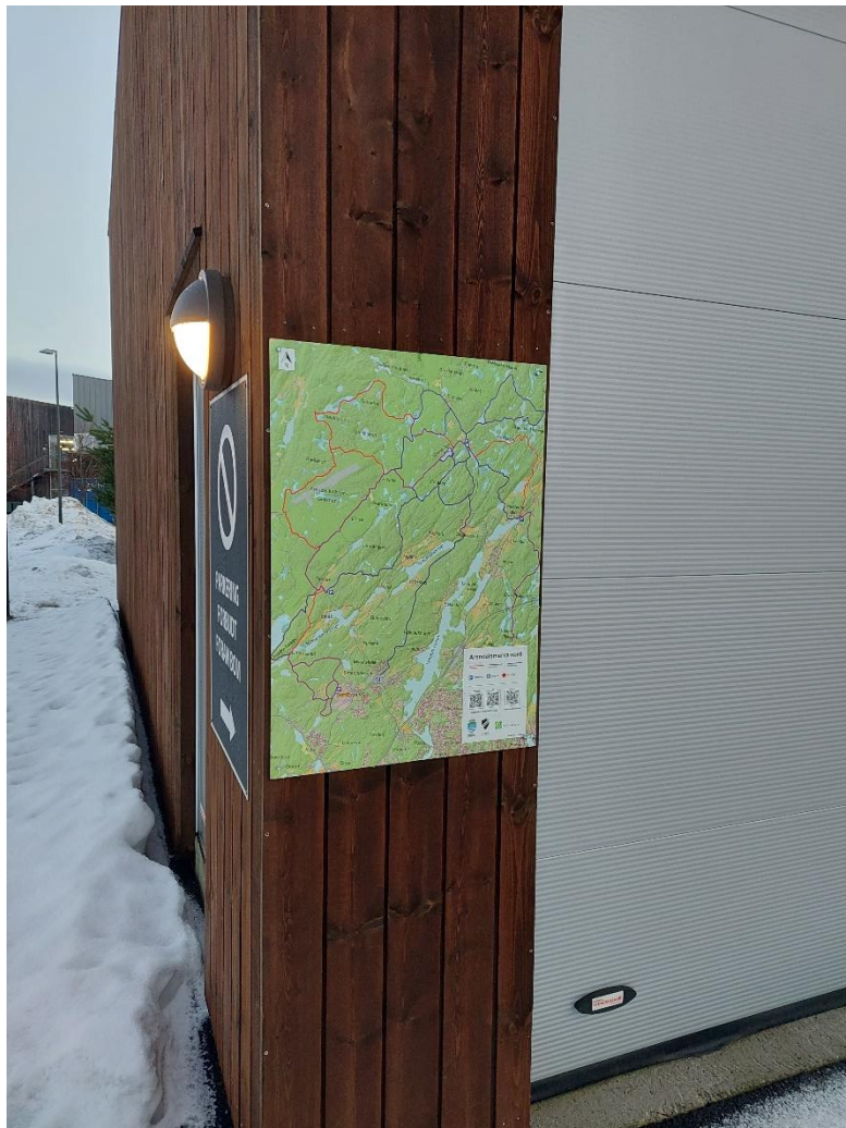
Infotavle ved Arendal Idrettspark.

Store informasjonstavler med kart over Arendalsmarka nord er nå satt opp på 8 ulike steder. Slikt kart er også satt på garasjeveggen ved start av lysløypa/turløypa fra Arendal Idrettspark. Kartet viser det sammenhengende løypetilbudet fra Idrettsparken til Granestua og videre knutepunktet mot Arendalsmarka øst ved Nesheim.