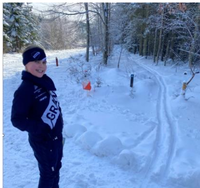
Bilder fra Nordjysk 2023